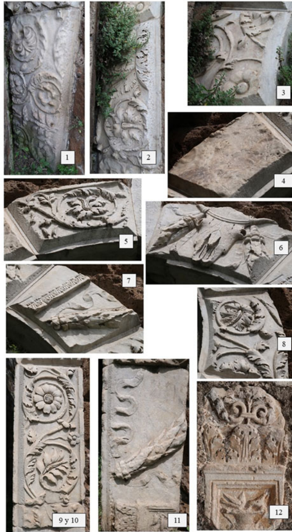
Fig. 6. Frammenti marmorei della Porta Borgiana.