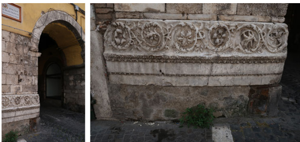
Fig. 4. Frammento del fregio del mausoleo di Cartinia in Piazza Matteotti di Civita Castellana.