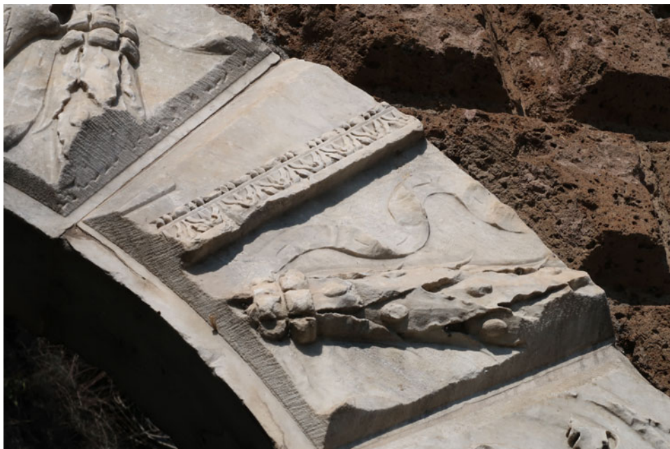
Fig. 7. Frammento marmoreo con kyma lesbio e l'attacco di una iscrizione [P] nella Porta Borgiana.

l'inserimento nella nuova costruzione della Porta Borgiana, come vedremo più avanti, una parte della sequenza compositiva corrisponde a uno dei pannelli laterali di accesso allo stesso monumento (Fig. 8). È possibile effettuare confronti generali con racemi vegetali molto simili in alcuni fregi di mausolei ben conosciuti, sebbene lontani dalla cronologia del nostro edificio, come quello di Caecilia Metella, nel quale appare anche la decorazione a bucrani con ghirlanda vegetale, interrotta all'altezza dell'epitaffio, o quello di Artorius Geminus, senza dimenticare altri esemplari conservati nei Musei Capitolini, tra i molti esempi di epoca claudia (Schörner, 1995: 52–54). Senza dubbio, alla luce di molti parallelismi, 8 possiamo collocare i nostri elementi decorativi in una fase compresa tra la fine del I sec. d.C. e l'età traianea momento in cui verosimilmente venne costruito il monumento a Publio Glizio ad opera della moglie. Si avvertono in questa epoca alcuni cambiamenti stilistici nella plasticità delle forme e nell'uso del trapano, che inizia a essere frequente, sebbene non venga utilizzato in maniera sistematica.