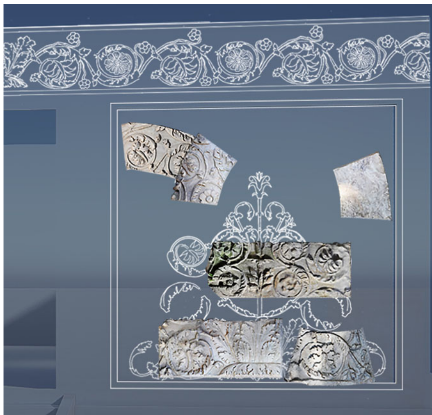
Fig. 10. Pannello laterale di un possibile accesso al monumento (Elaborazione grafica originale di Adriana Cymerman, Antonio Pizzo e Paloma Martín-Esperanza).

Castellana e le sue attività archeologiche in Etruria permettono di stabilire un interessante trait d'union con la Porta Borgiana.