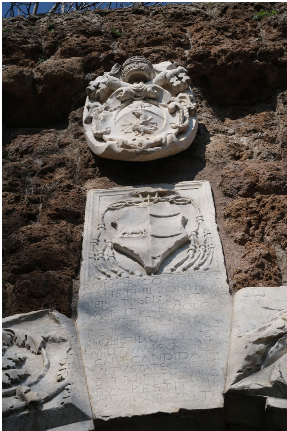
Fig. 2. Chiave di volta della Porta Borgiana, con l'iscrizione dedicata a Rodrigo Borgia.