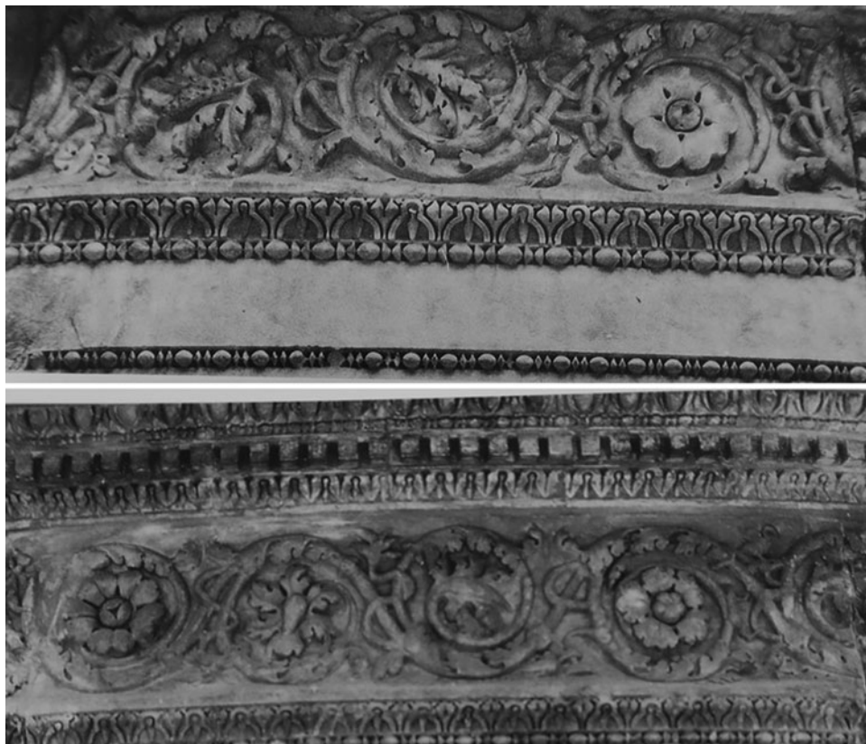
Fig. 5. Fregi provenienti dal mausoleo di Cartinia conservati nel Pergamonmuseum di Berlino (Schörner, 1995: Tav. 36, n° 3; Tav. 37 n° 1).