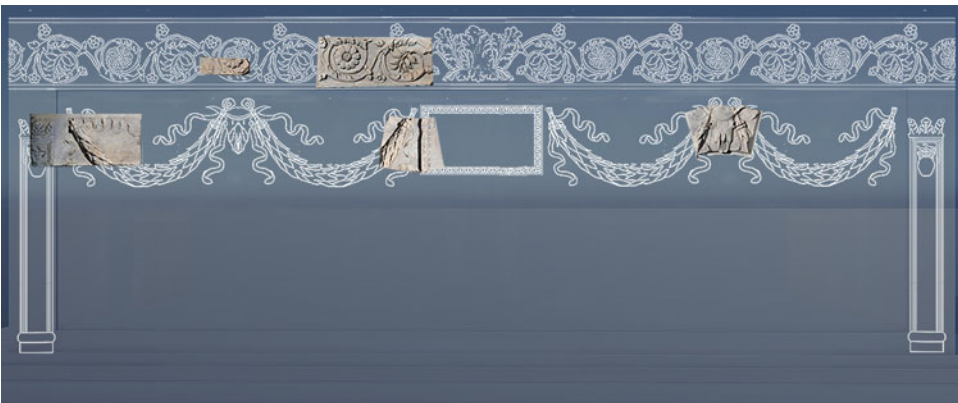
Fig. 9. Pannello laterale del monumento funerario (Elaborazione grafica originale di Adriana Cymerman, Antonio Pizzo e Paloma Martín-Esperanza).

Come accennato, i materiali marmorei recuperati dal mausoleo di Publio Glizio servirono agli abitanti di Civita Castellana per erigere una antiporta monumentale in onore del governatore della città, il celebre cardinale Rodrigo Borgia. Tale omaggio riveste un interesse particolare alla luce della personalità del futuro papa Alessandro VI, che si rivelò un autentico promotore del Rinascimento, non soltanto nella città di Roma, ma anche negli altri territori dello Stato Pontificio, conservando un interesse politico speciale per l'area dell'antica Etruria, dove si trova Civita Castellana, il cui dominio cercò di legittimare attraverso argomentazioni storiche e archeologiche (Carbonell i Buades, 1992; Stephens, 1984, 2004). I suoi progetti urbanistici per Civita