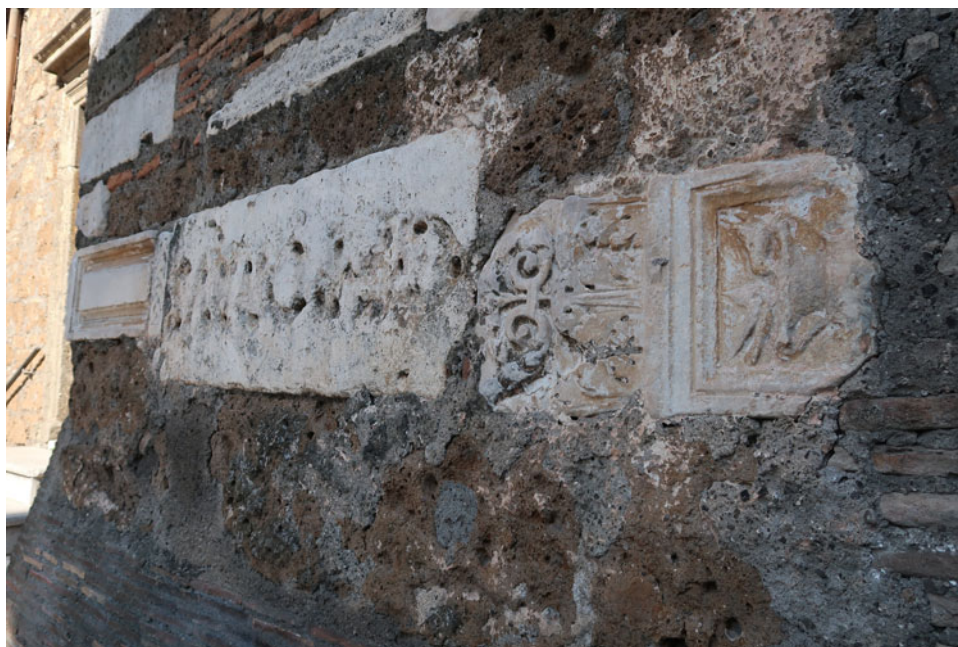
Fig. 3. Spolia nel campanile della chiesa di Santa Maria del Carmine.

Grazie al lavoro portato a termine a Civita Castellana, abbiamo potuto identificare una significativa quantità di materiale marmoreo nelle altre aree urbane, relativo anch'esso a edifici di carattere funerario (Fig. 3) (Götze, 1939). In particolare, oltre ai frammenti inseriti nel nartece del duomo di Civita