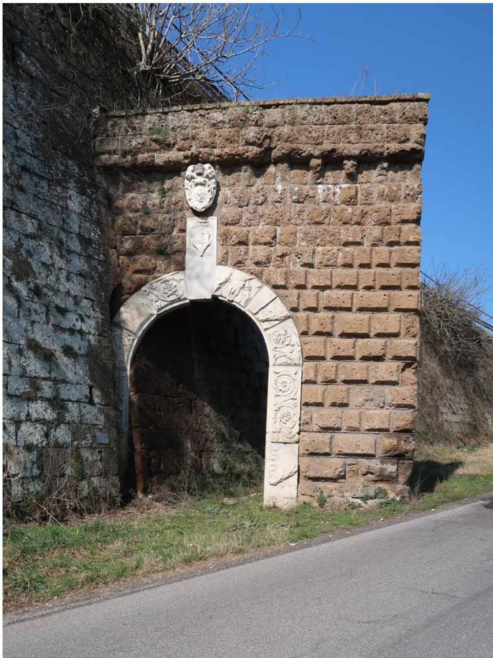
Fig. 1. Immagine frontale della Porta Borgiana di Civita Castellana.