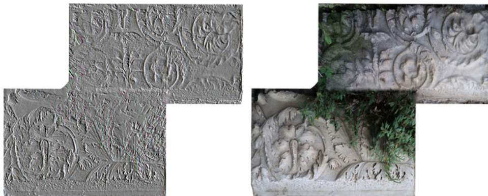
Fig. 8. Ricostruzione di un pannello decorativo, a partire dai frammenti marmorei della Porta Borgiana.

cui vestigia sono tuttora parzialmente visibili; grazie alle ultime indagini geofisiche, sono state individuate tracce di altre strutture simili (Keay et al., 2000: 64–69; v. anche Hay et al., 2010: 18). Così come Stefano Manzella (1979: 98–99) metteva in relazione i materiali marmorei reimpiegati nel duomo con la necropoli di Falerii Novi, è opportuno mantenere questa stessa ipotesi per il monumento funerario di Publio Glizio, senza scartare le altre possibili opzioni, come, per esempio, la presenza di aree funerarie nei pressi della Via Flaminia, nei dintorni del comune di Civita Castellana (Esch, 1998: 73). Per quanto riguarda l'area funeraria di Falerii Novi, le recenti prospezioni e l'impiego della magnetometria hanno permesso di identificare un numero considerevole di mausolei – alcuni già conosciuti in passato – di struttura quadrangolare o cilindrica, con differenze nei rispettivi dettagli planimetrici (Hay et al., 2010: fig. 17). Sebbene alcuni di essi potrebbero corrispondere a quello di Publio Glizio, le evidenze architettoniche sono insufficienti per giungere a una conclusione plausibile e proporre una identificazione, certa e coerente, con un edificio specifico.