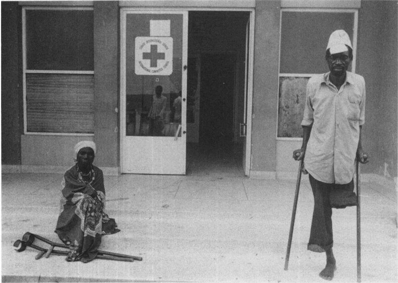
Angola: Centro ortopédico de Bomba Alta para equipar y rehabilitar a los amputados